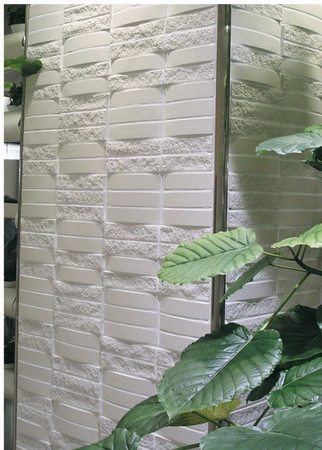
CC-007と『モダンテッセラ』MOD-007との 組合せ例