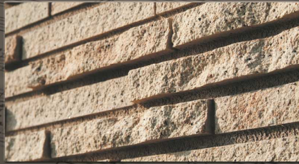
カンタービレ 227×30×10テッセラ 227×30×5~35テッセラ 1:1 MIX