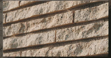
フォルテ 227×30×5~35テッセラ