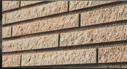
レガート 227×30×10テッセラ